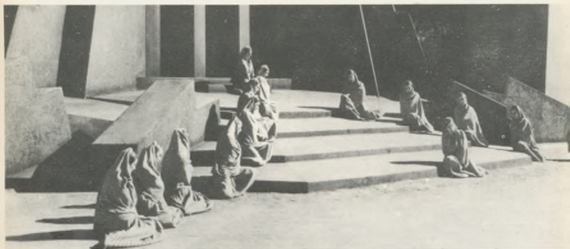
"IPHIGENIA IN TAURIS., CHORUS